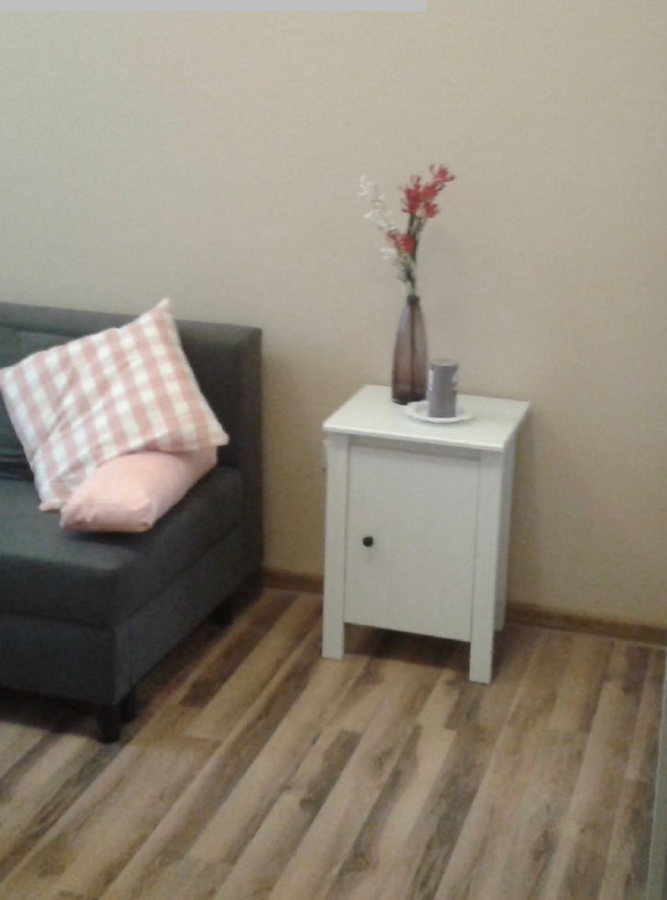
Przed Home Stagingiem