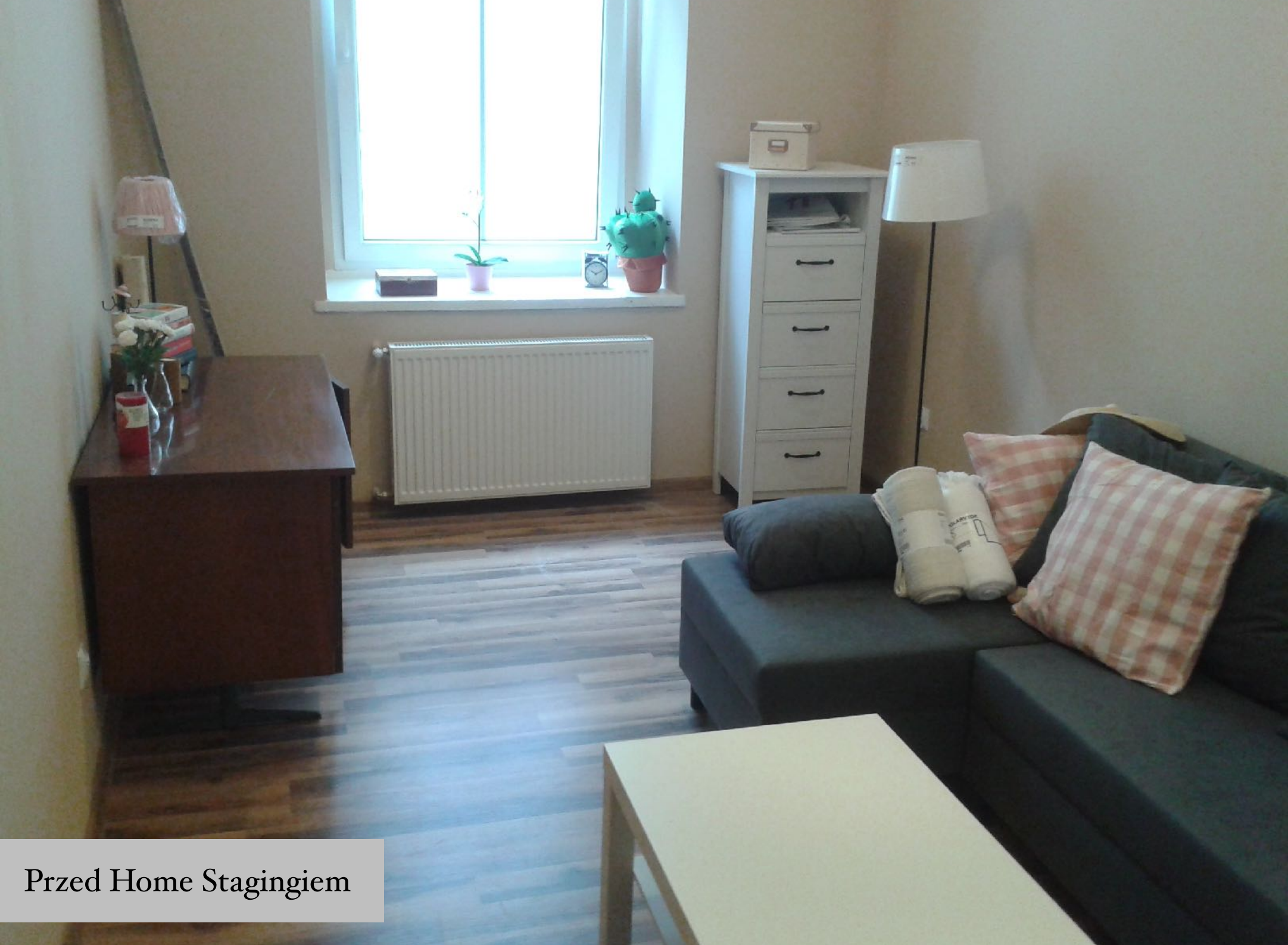
Przed Home Stagingiem