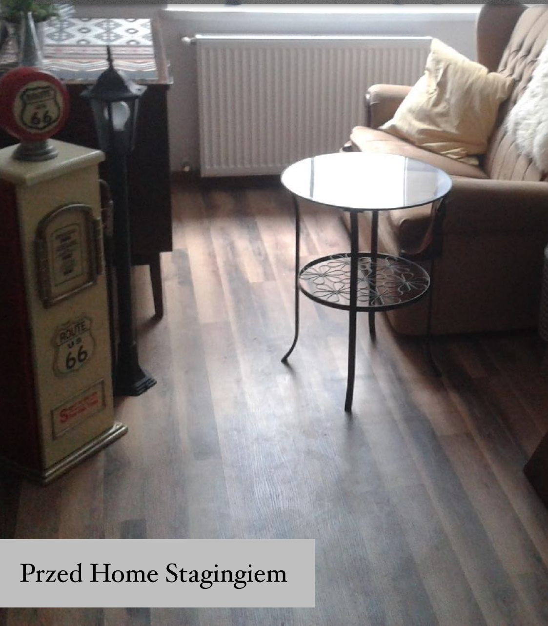
Przed Home Stagingiem

Zły kadr, nieostre zdjęcia, nieodpowiednie oświetlenie, bałagan w ustawieniu mebli - to najczęstsze błędy, które powodują słabe zainteresowanie przyszłych lokatorów.